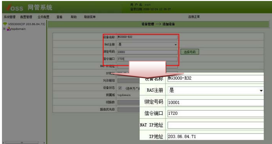
图 3-2 网关设置