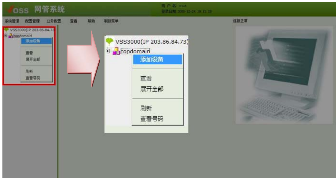
图 3-1 添加落地网关

在登陆 Voss 网管系统之后，在右侧找到 topdomain ，单击鼠标右键，如下图所示：