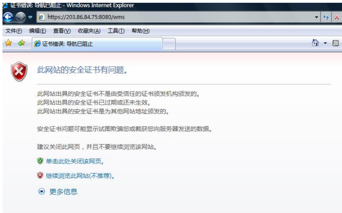
图 2-1 网站安全证书

此时点击“继续浏览此网站”，界面就会显示出登陆页面（图 3）。该选项您可放心点击，不会造成任何不良影响。