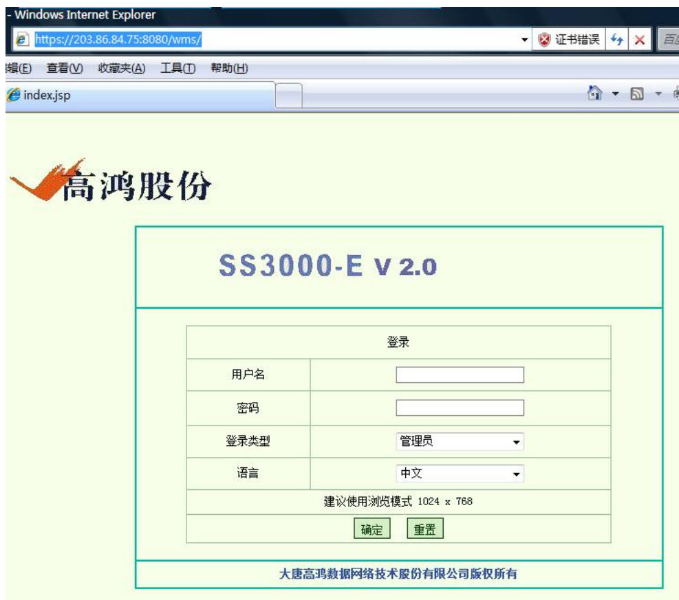
图 2-2 登录界面

此时点击“继续浏览此网站”，界面就会显示出登陆页面（图 3）。该选项您可放心点击，不会造成任何不良影响。