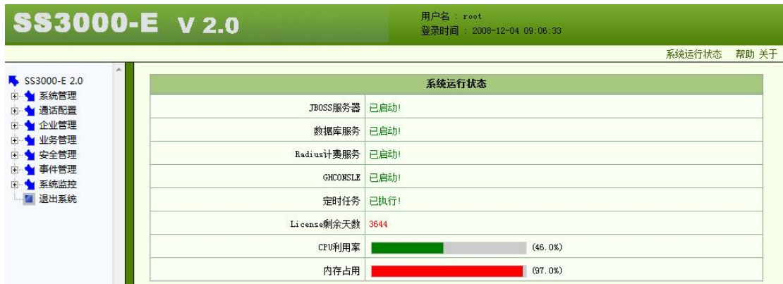
图 2-3 成功登录后的界面