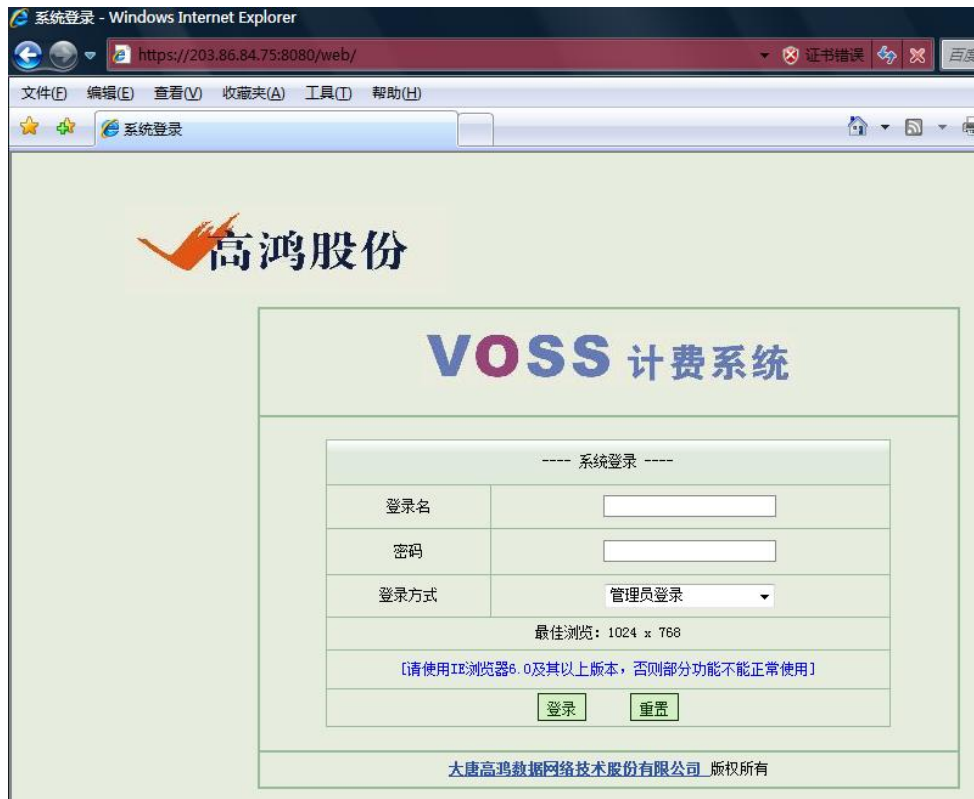
图 3-1 计费系统登录界面

同样，用 IE7 浏览器可能会遇到出现“此网站的安全证书有问题”的提示，无需犹豫，直接点击“继续浏览此网站”，进入登陆计费界面,如下图(图 5)所示，还是以 IP 地址为 203.86.84.75 的平台的登陆为例：