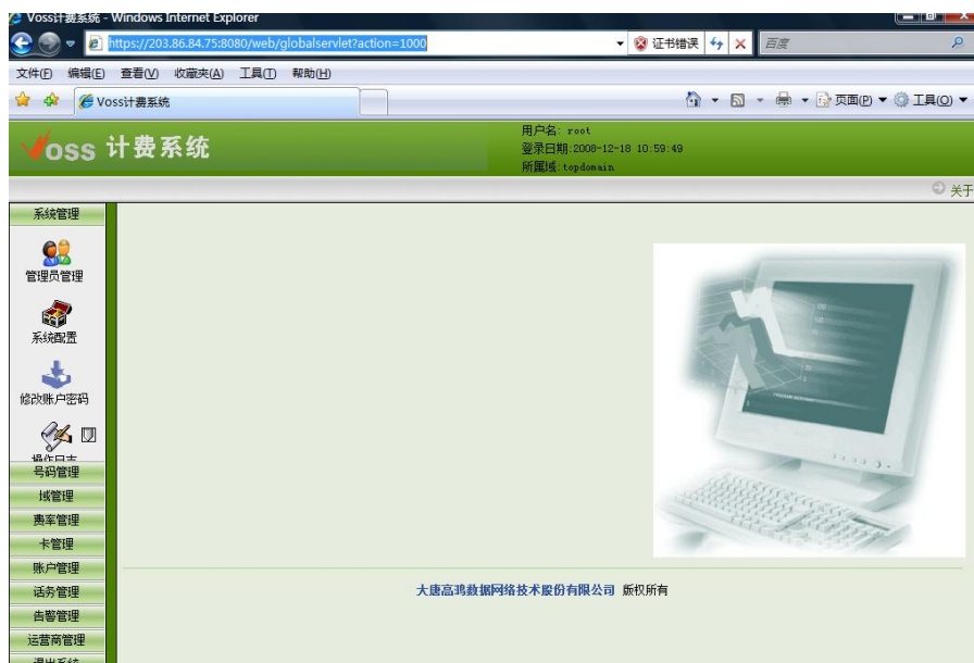
图 3-2 成功登录后的界面

认是 root123)，登录类型建议选择管理员，然后点击确定，会出现如下页面（图 6），说明您已经成功登录到 SS3000-E v2.X 的计费界面，这时您就可以在此页面上选择需要配置的选项了。